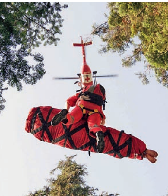
Wenn kein Rettungsfahrzeug mehr durchkommt im Gelände, bleibt der Rettungshubschrauber die einzige Alternative.

Ja, eine besonders tragische Geschichte: Einer unserer älteren Kameraden, ein Bergwacht-Urgestein, ist bei einem Absturz an einem 50-Meter-Hang auf der Alb oben bei Schopfloch ums Leben gekommen, als er einem Wanderer den Fotoapparat heraufholen wollte, den der hatte hinunterfallen lassen.