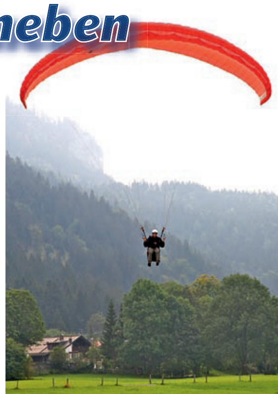
Paragliding ist mit der richtigen Ausrüstung ein recht sicherer Sport.

Um die Bergwelt richtig genießen zu können, gehört die sorgfältige Vorbereitung einer Wanderung unbedingt dazu.