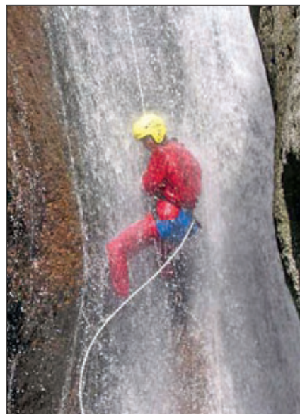
Canyoning: Klettern im Wasserfall.

Einsätze wie dieser wären bei weniger „Action“ im Gelände – mit weniger Kick und Fun – ganz gewiß nicht erforderlich. Manchmal kann Kletterer und Bergwacht-Geschäftsführer Mess nur noch den Kopf schütteln: „Wenn ich sehe, welche Abhänge Mountainbiker runterfahren, die ich nicht mal zu Fuß runtergehen würde.“