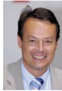
Von Klaus Tappeser Präsident des WLSB